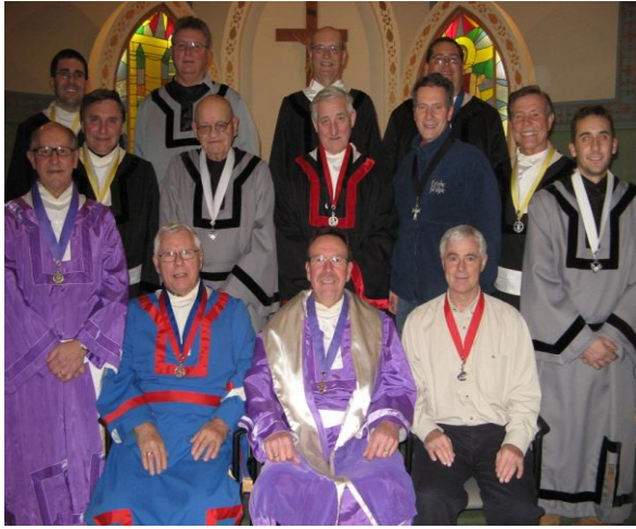
Le conseil des Chevaliers de Carlsbad Springs a été fondé en mars 1987 et depuis, nous appuyons tous les comités et organisations paroissiales.

Le conseil exécutif est formé du Grand Chevalier et du Député G. Chevalier, du chancelier, du secrétaire financier, du trésorier, du cérémoniaire, de l'intendant, du secrétaire-archiviste, de 3 syndics et de 2 gardes.